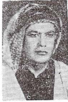
السيد راشد خلف الكعبي الأمين العام للجبهة الوطنية لتحرير عربستان