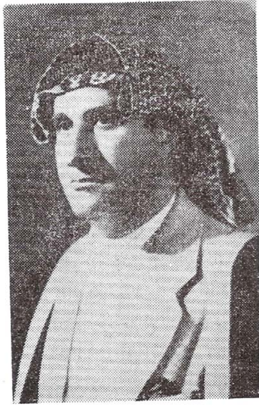
الشيخ عبد الله الخزعل قائد ثورة سنة ١٩٤٠